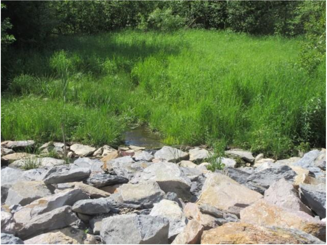
IMG_1960.JPG Exutoire du bassin